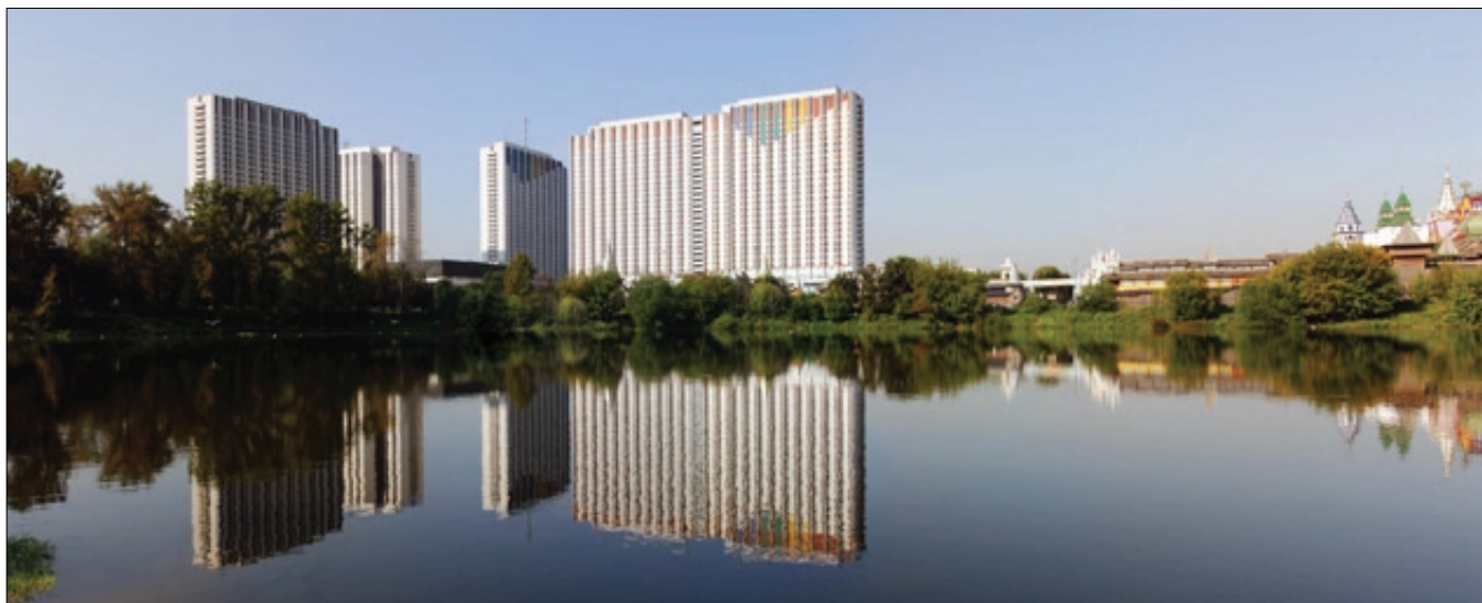
Гостиничный комплекс «Измайлово», Москва