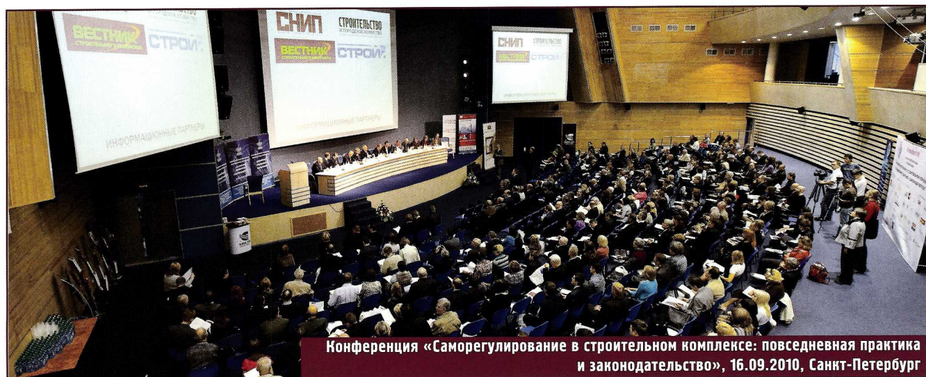
Конференция «Саморегулирование в строительном комплексе: повседневная практика и законодательство», 16.09.2010, Санкт-Петербург

Огромную роль в развитии саморегулирования в России играют Национальные объединения саморегулируемых организаций в области строительства, проектирования и инженерных изысканий. В рамках Национальных объединений ведется работа по созданию документов в области технического регулирования, унифицированных